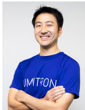
ウミトロン(株) 代表取締役