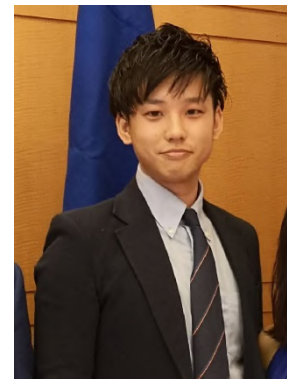
(同)Yspace 共同代表 Co-CEO/Co-founder