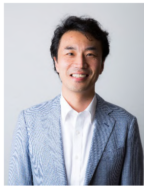
A.T. カーニー(株) プリンシパル・ (一社)SPACETIDE 代表理事兼CEO